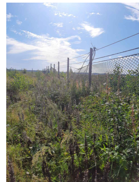
Nykyinen lentokentän suoja-aita, monin paikoin huonokuntoinen