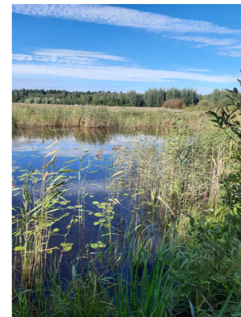
Maisema lintutornin läheisyydestä