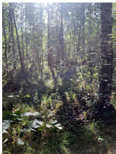
Maastoa lähtöpaikan läheisyydessä.