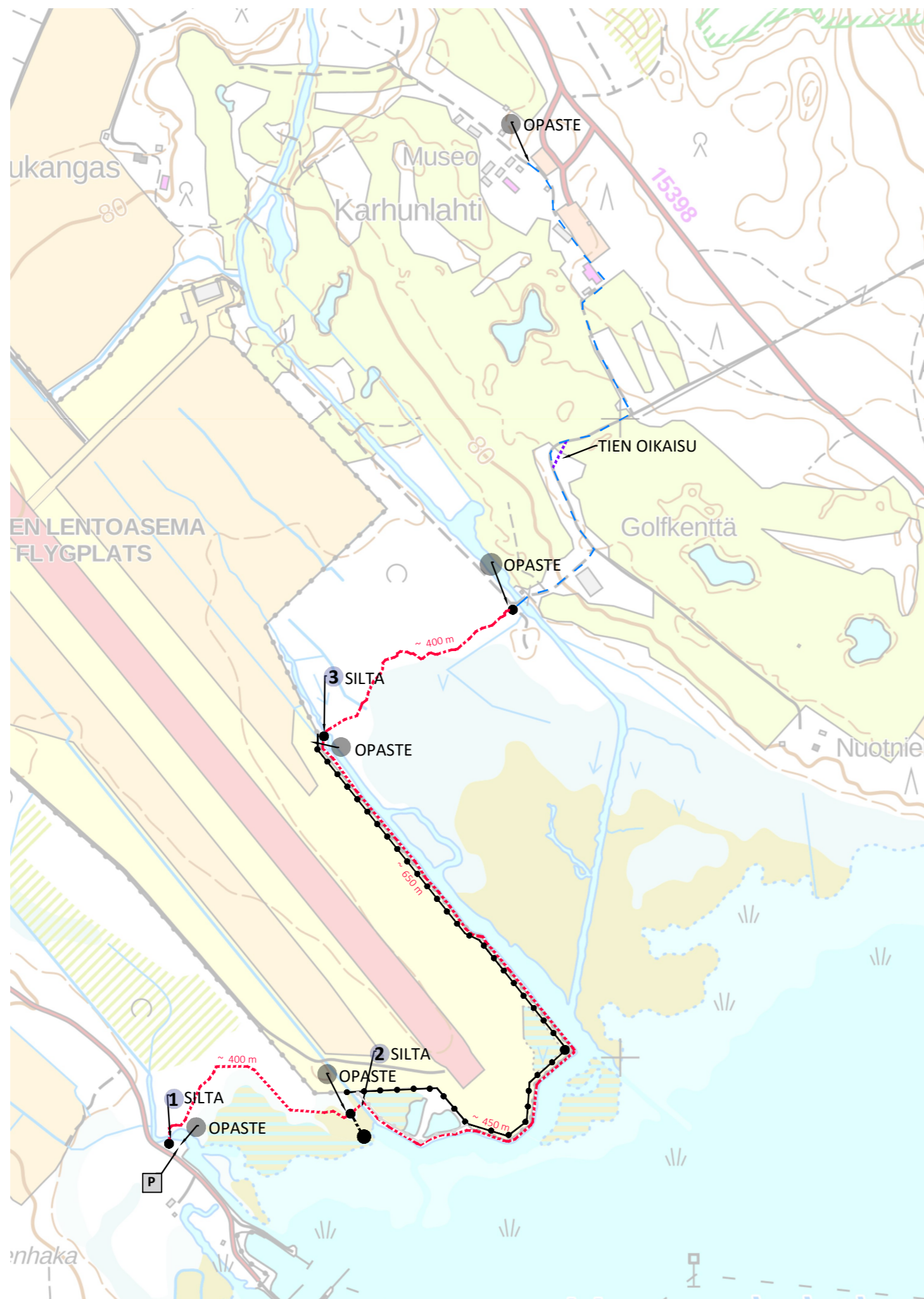
Ulkoilureittisuunnitelma 1: 7 500